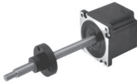
Size 34 外部驱动式