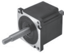
Size 34 贯通轴式